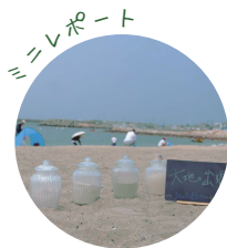
E~マッチらいふプロジェクト (明石市)