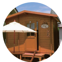
ぱびるペパン屋 (稲美町)

その他、インタビューやレポートはWEBサイト、Facebookページにてご覧いただけます。